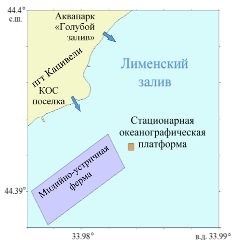
Рис. 1. Район исследования