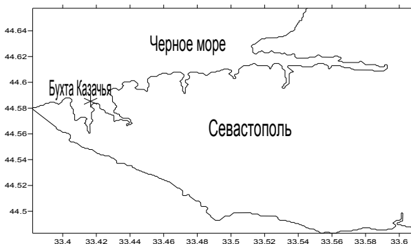
Рис. 1. Район отбора проб эпифитона zostеры.

Зарослевые сообщества прибрежной акватории имеют наиболее динамичную структуру, поскольку находятся под прессом не только природных (прибойность, перепады температур), но и антропогенных (загрязнение, рекреационная нагрузка) факторов. Донные биоценозы реагируют на внешние воздействия, вызванные деятельностью человека, изменением видового состава и соотношением численности видов с различной устойчивостью к загрязнению. В зарослях макрофитов создаются благоприятные условия для обитания большого количества организмов самой разнообразной трофической принадлежности. Эпифитон рода Zostera относится к одному из наиболее типичных в Черном море [1 – 3]. Тем не менее, данный биотоп у берегов Крыма малоизученный. Были исследования лишь в 1967 г. в Каркинитском заливе и в 1970 – 1971 гг. в бухте Казачья [2, 3]. Данная бухта является одной из наиболее крупных бухт Севастопольского взморья и расположена