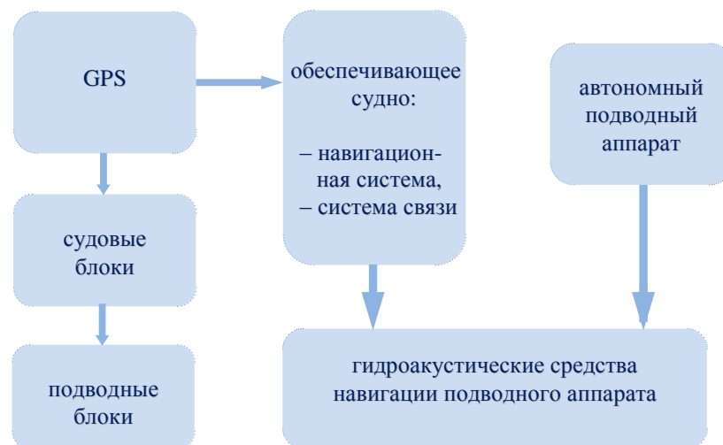
Р и с . 3 . Схема навигации подводного аппарата.

В [19] приводится описание характеристик типового гидролокатора, разработанного Акустическим институтом им. акад. Н.Н.Андреева и предназначенного для освещения подводной обстановки с использованием необитаемых