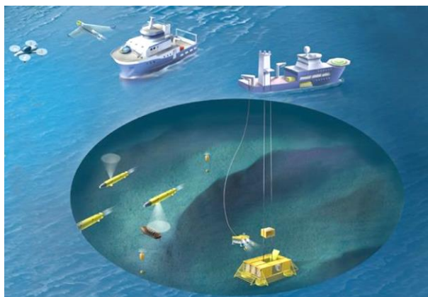
Р и с . 1 . Системы мониторинга [12].

Использование подводных аппаратов для геологоразведки. Работа [12] посвящена исследованию проблем, связанных с автономными морскими системами, применяемыми для морских перевозок, разведки и разработки нефти и газа, для рыболовства и аквакультуры, науки об океанах, морской возобновляемой энергии, морской добычи (рис.1). Фундаментальные знания получают с помощью междисциплинарных теоретических, численных и экспериментальных исследований в областях гидродинамики, структурной механики, навигации, управления и оптимизации. В работе